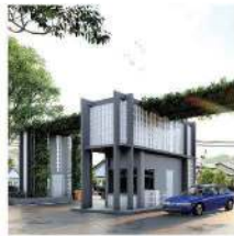
Gated & Guarded