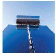
Solar Heater Point / Hot Cold Water Piping